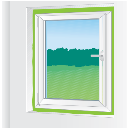
Verfüllung von Fensteranschlussfugen

Nur in gut belüfteten Räumen verarbeiten. Nicht rauchen! Augen schützen, Handschuhe und Arbeitskleidung tragen. Schaumspritzer sofort mit PUR-Reiniger oder Aceton entfernen. Ausgehärteter Schaum kann nur mechanisch