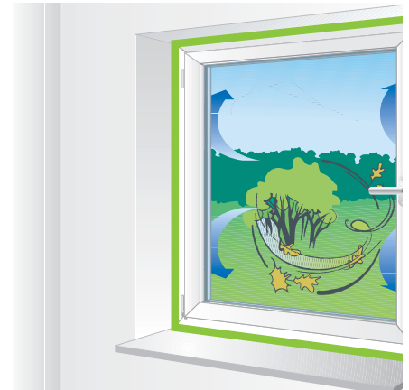
„i3“ geprüfte Qualität